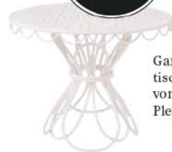
Garten-Beistell- tisch „Al Fresco“ von Business & Pleasure, um 550 €